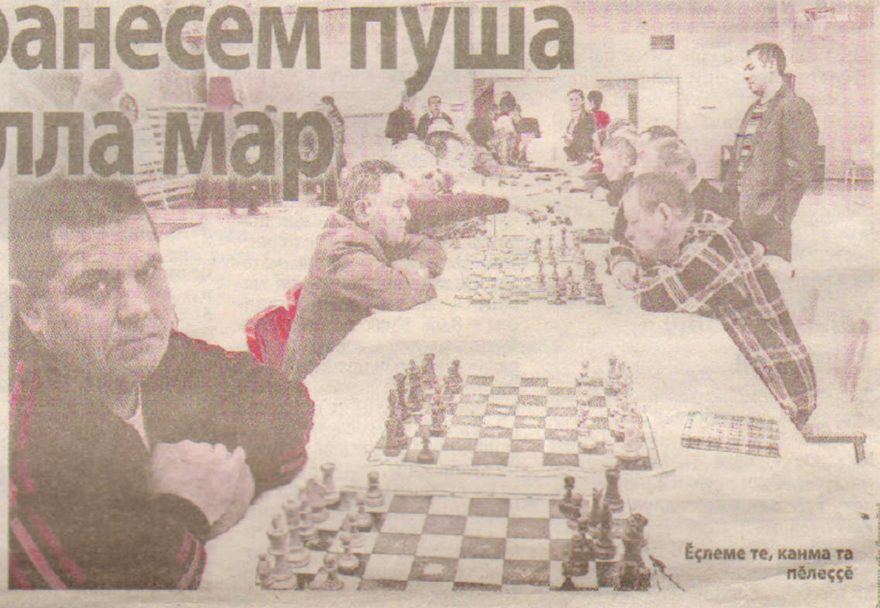
Ёслеме те, канма та пĕлесĕ