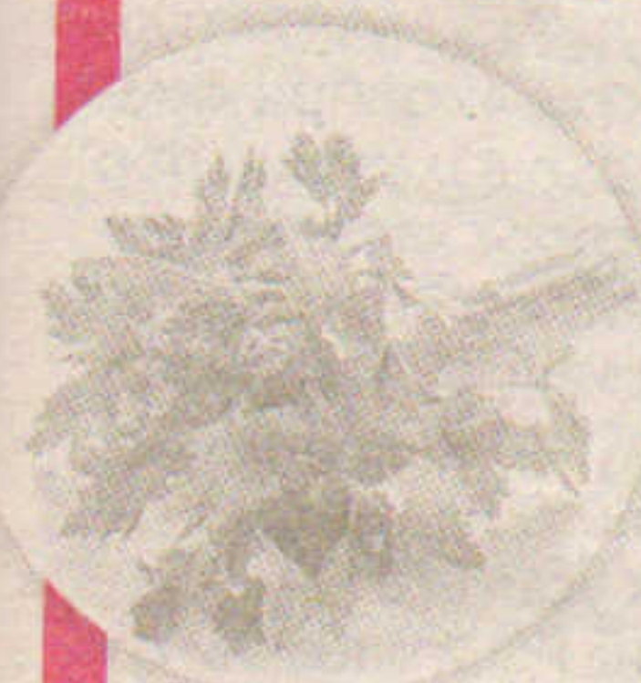
Рис кәрпенкә пистәр тесен аңа малтан кастрюль хуппипе витмәсәр вәйлә сүләм сиче 5 минут вәретмелле. Тумтир сичи уюг сунтарнә ыраңа водород йүсәкәне йәпәтсе тасатма пулать.